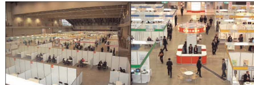
前回のFITネット商談会の様子